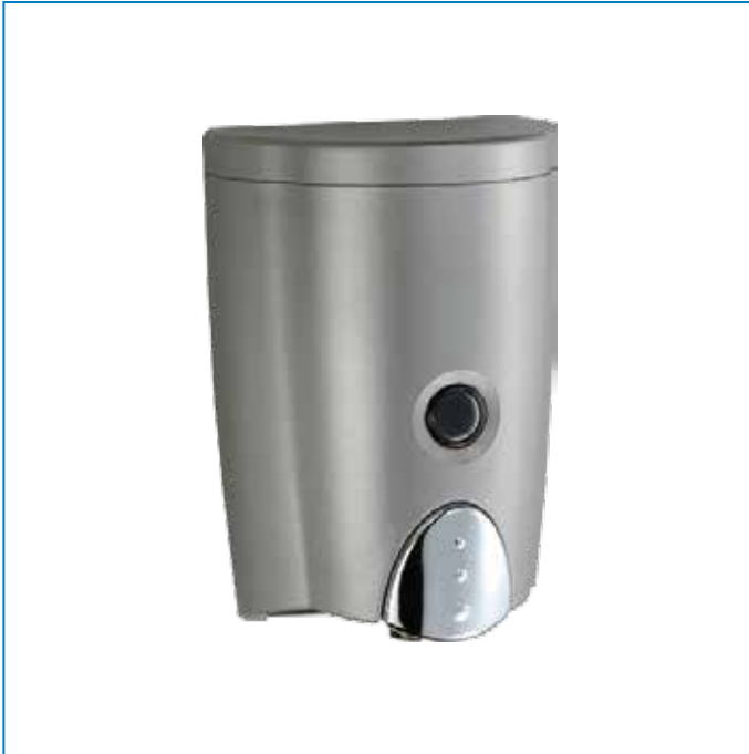
Hộp nhấn xà phòng 1 hộp