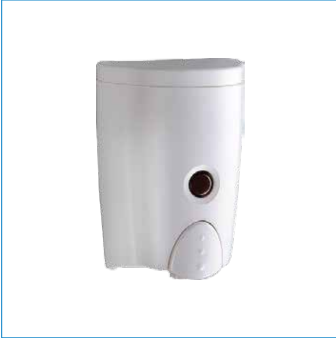
Hộp nhấn xà phòng 1 hộp