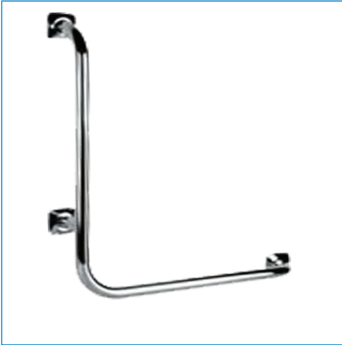
Swing Handrail For The Disabled