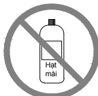
Không nên sử dụng