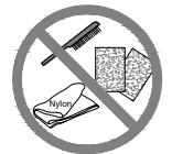
Metal brush, sandpaper, nylon cloth