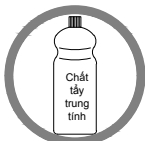
Nên sử dụng