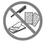
Bàn chải sắt, giấy nhám, vải nylon