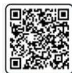
Scan QR for the videos using and product care instructions

Sincere thanks to Valued client for your trust and use products of TOTO To find out about suitable detergents, please visit the website: https://vn.toto.com